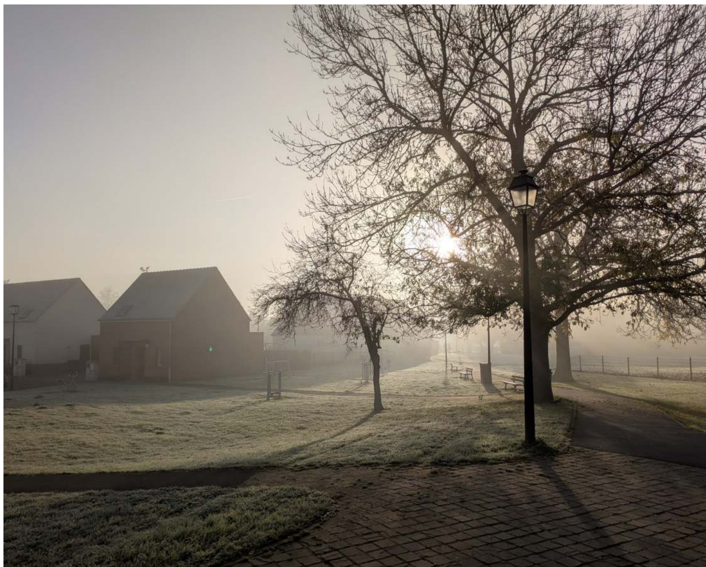
Chemin piétonnier des écoles