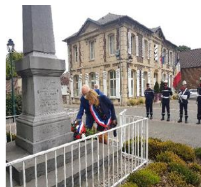
Cérémonie du 14 juillet

Toutes ces cérémonies se sont déroulées en petit comité pour respecter les mesures sanitaires et les gestes barrières. Nous avons honoré, rendu hommage aux combattants, aux victimes, de la première et seconde guerre mondiale, ainsi qu'aux ulmeusiens morts pour la France.