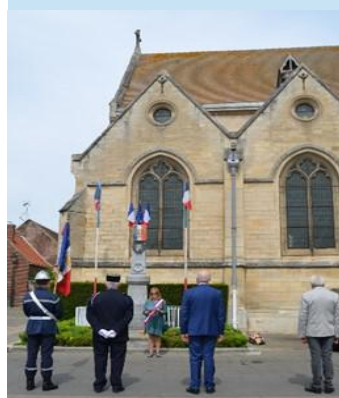
Cérémonie du 08 mai