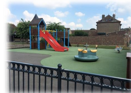
AIRE DE JEUX DU CENTRE BOURG