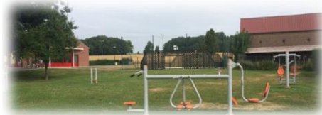
AIRE DE FITNESS