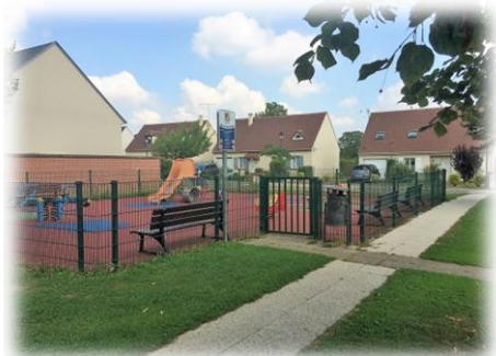
AIRE DE JEUX DU VALLON