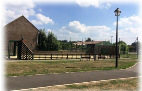
CITY STADE ( rue Bazin)