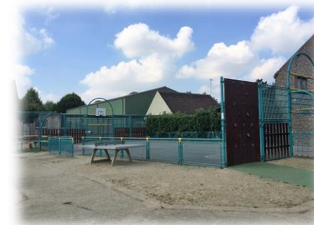
CITY STADE DU CENTRE BOURG